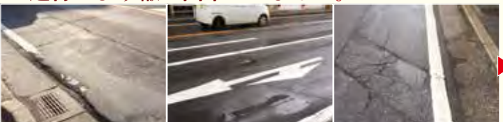
【アスファルトの舗装・再施工】

②. 「津田沼十字路」には県道69号線が東西に走っています。津田沼十字路から新京成電鉄の踏切までの間のアスファルト舗装は、長年の大型車両等の通行により轍が出来ていました。