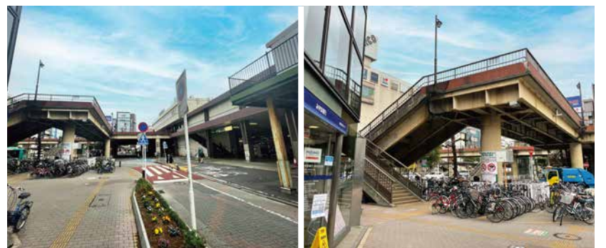
エレベーター設置を希望している場所

《概要》 ペDESTリアンデッキに上がる公共エレベーター設置については、船橋市域、習志野市域、千葉県道など複雑な地域性の中、みずほ銀行前が行政より提示されました。JR東日本側とはJR津田沼駅に昇る階段をエスカレーターにする話し合いを継続しながらも、公共エレベーターの設置位置としてはここに一点集中して、行政区域である習志野市と折衝していくことになりました。