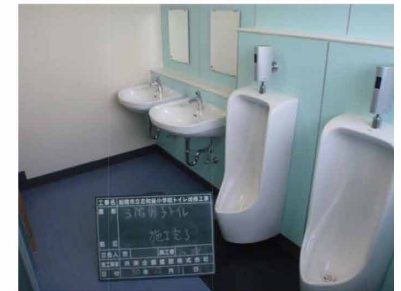
床：シート 小便器 自動