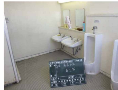
床：タイル 小便器 手動