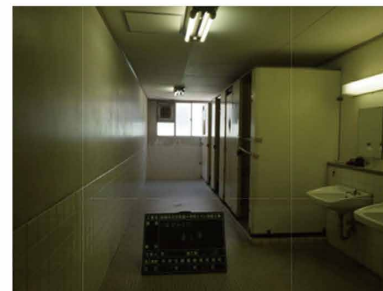
壁、トイレブース、照明