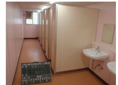
壁、トイレブース改修、照明 LED